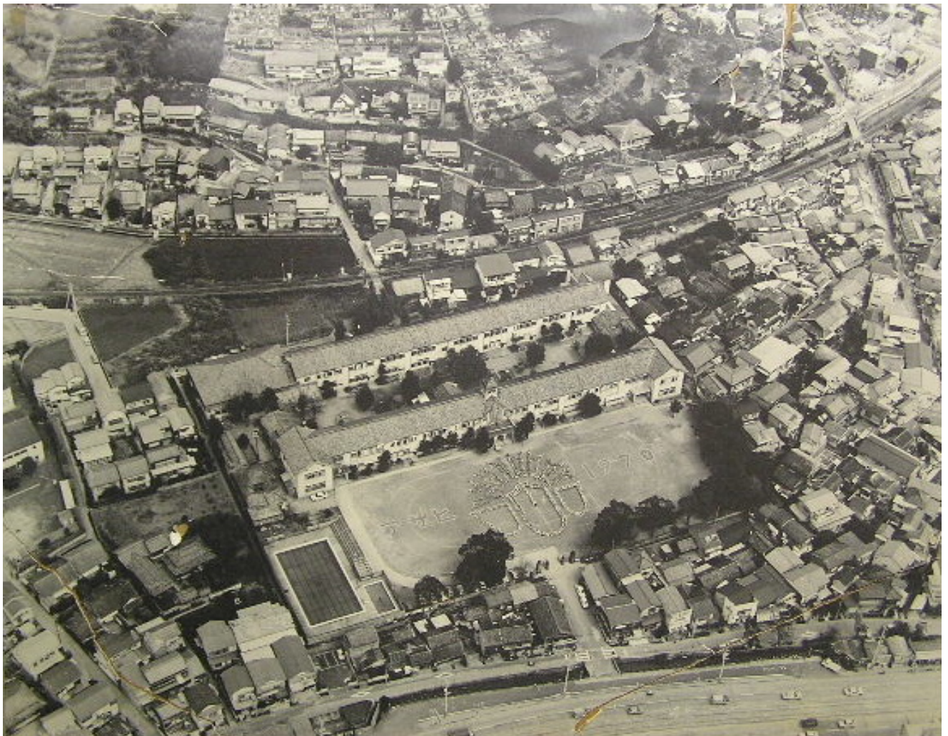
(休校舎が懐かしい)