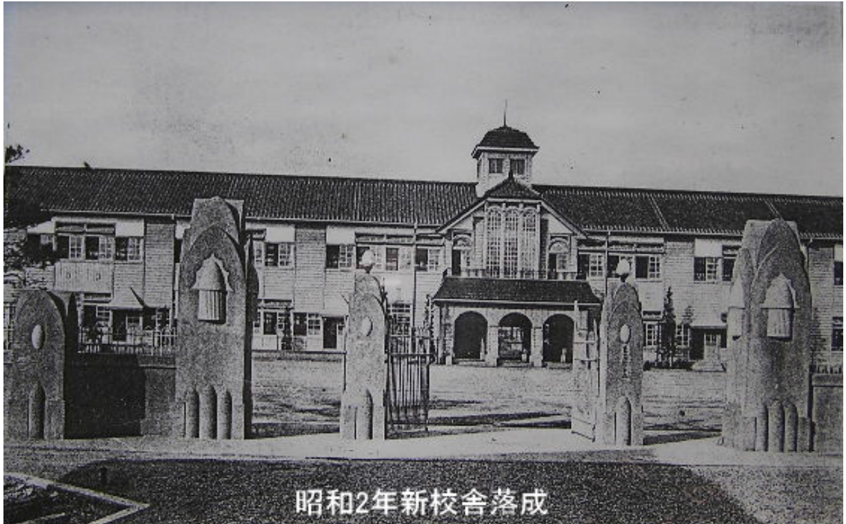
ドイツ表現派の校門

アールデコより少し早い時期にドイツで興った近代建築様式で、いわゆるドイツ表現派とか、表現主義派とか呼ばれる意匠といえる。時代の精神の高揚を立体化、具体化したものである。